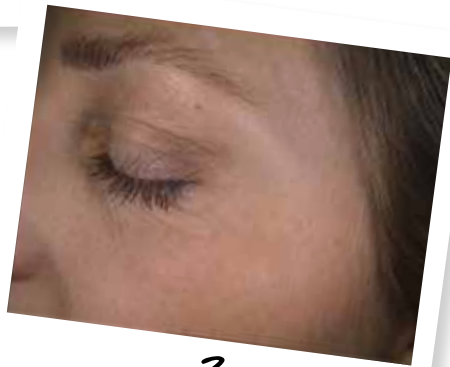
Avant et Après traitement du contour des yeux

injection d'acide hyaluronique au niveau des zones fragilisées : le but est de prévenir, de consolider et de réparer les zones gênantes pour la patiente. A ce stade on utilise un acide hyaluronique de viscosité faible et une injection au niveau du derme superficiel pour obtenir une atténuation des rides ainsi qu'un effet tenseur cutané. Il est possible d'associer les techniques combinées (voir ci-dessous). En général deux séances à trois mois d'intervalle sont nécessaires puis un entretien tous les 6 mois.