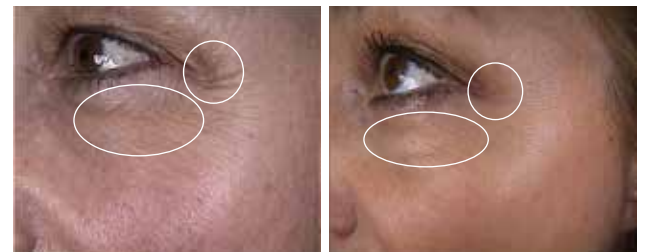
Remaillage dermique et toxine botulique

Lissage cutané : améliore les plis au coin des yeux